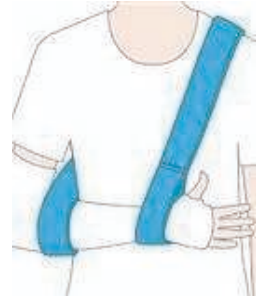
Collar and Cuff