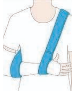
Collar and Cuff