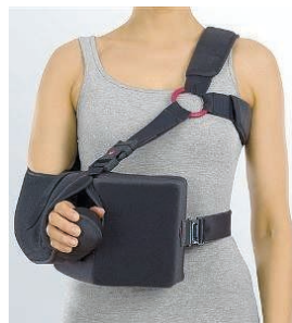
Udad rotations slynge